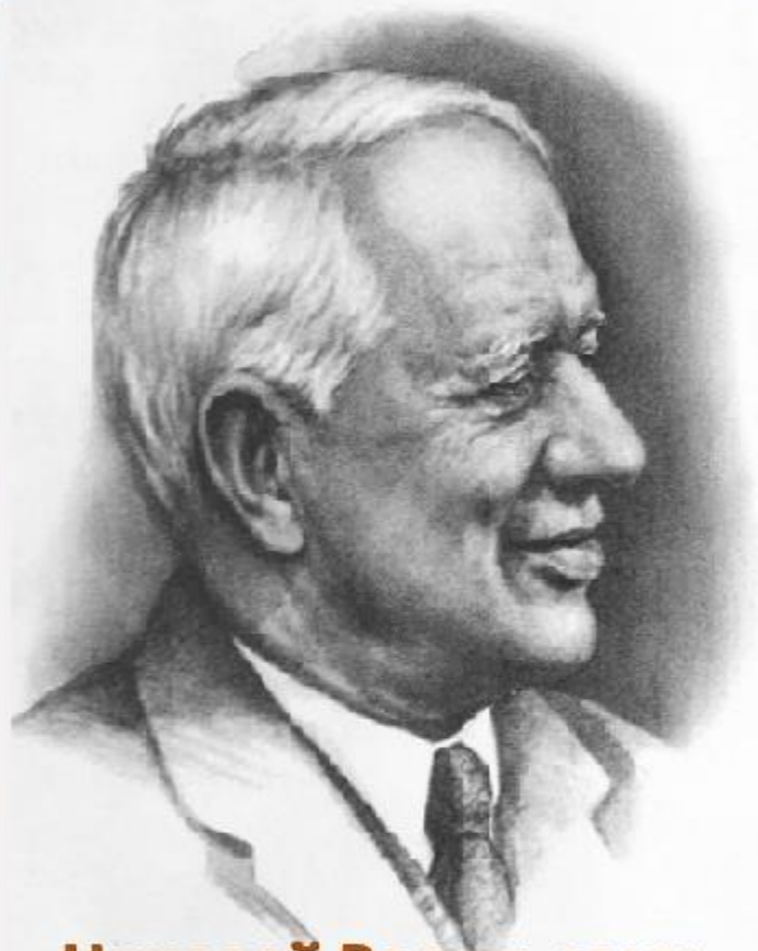
Николай Васильевич Корнейчуков